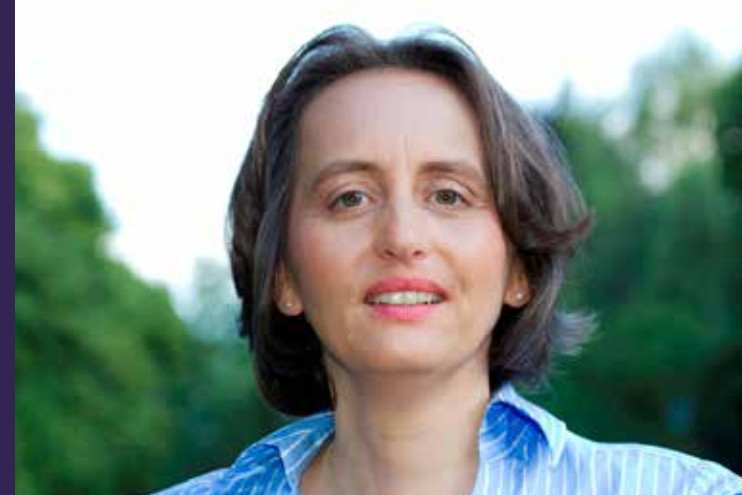
Beatrix von Storch:

Deutschland ist ein säkulares Land mit einem liberalen Rechtsstaat. Dieser hat für alle Gültigkeit, die hier leben. Wenn der Rechtsstaat durch islamische Parallelgesellschaften und die Scharia-Justiz ausgehöhlt und unterwandert wird, dann ist unsere Freiheit bedroht. Die Regeln und Gesetze müssen für alle gelten. Politik und Justiz versagen darin, unsere Regeln und Gesetze konsequent durchzusetzen. Deshalb müssen wir Bürger gemeinsam fordern, dass unser Rechtsstaat durchgesetzt wird und Scharia-Recht und Scharia-Richter mit den Mitteln des Rechtsstaates bekämpft werden. Deutschland ist ein freies Land und muss es bleiben.